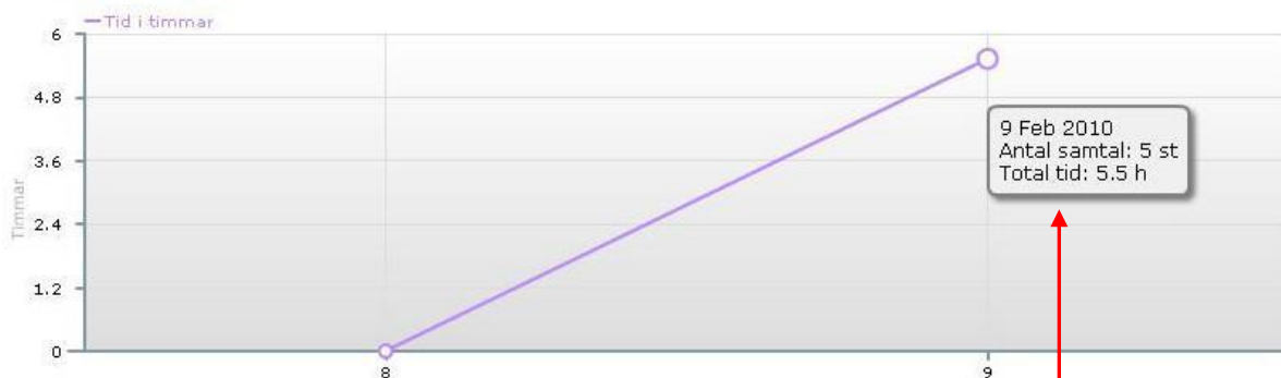
Konferens 3: Februari 2010

Lägg musen på respektive konferens så visas mer detaljer om mötet